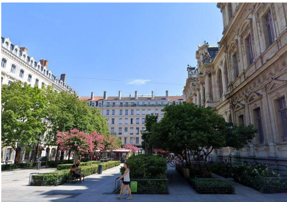
Place de la Bourse à Lyon

Le Centre est hébergé au sein de la CCI de Lyon au 3, Place de la Bourse, en plein centre de Lyon. Les formations ont lieu sur place. Certaines formations ont lieu dans les locaux de l'Université Jean Moulin Lyon 3, 15 Quai Claude Bernard.