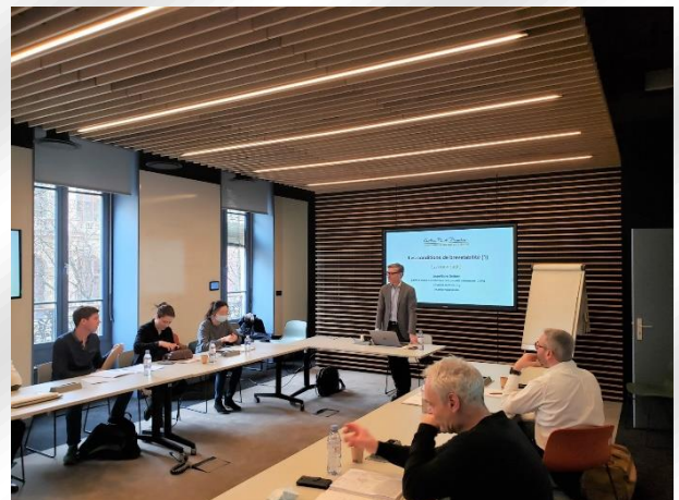
Une salle de formation (cycle brevet)

Le programme des formations peut être adapté aux besoins des entreprises. Les formations sont assurées par petits groupes, dans les salles de formation du Centre, et en hybride. Elles peuvent également, sur devis, être assurées au sein d'une entreprise. Un nombre minimum de stagiaires est requis pour l'organisation d'une session. Le calendrier des sessions est fixé en fonction des demandes reçues en début d'année et selon les disponibilités des formateurs, et peut être ajusté selon les besoins ou l'actualité.