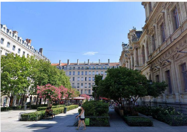
Les locaux du Centre, 3 place de la Bourse à Lyon

L'offre entreprises consiste dans un catalogue de formations ad hoc de haut niveau destinées aux entreprises, développées par le Centre Paul Roubier sur des sujets d'actualité ou d'importance stratégique dans le domaine de la protection de l'innovation.