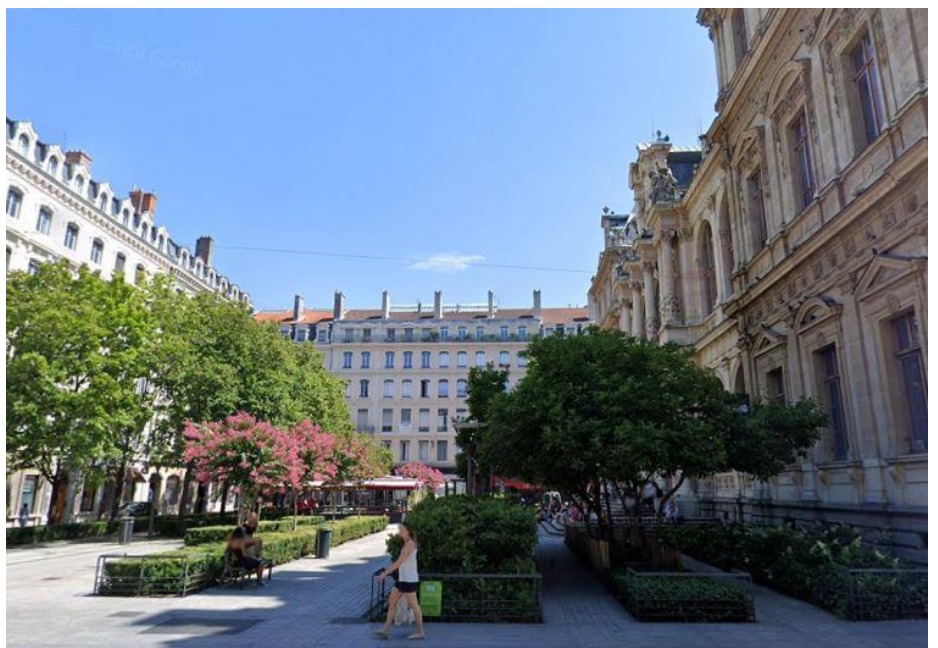
Place de la Bourse à Lyon

Le Centre est hébergé au sein de la CCI de Lyon au 3, Place de la Bourse, en plein centre de Lyon. Les formations ont lieu sur place. Certaines formations ont lieu dans les locaux de l'Université Jean Moulin Lyon 3, 15 Quai Claude Bernard.